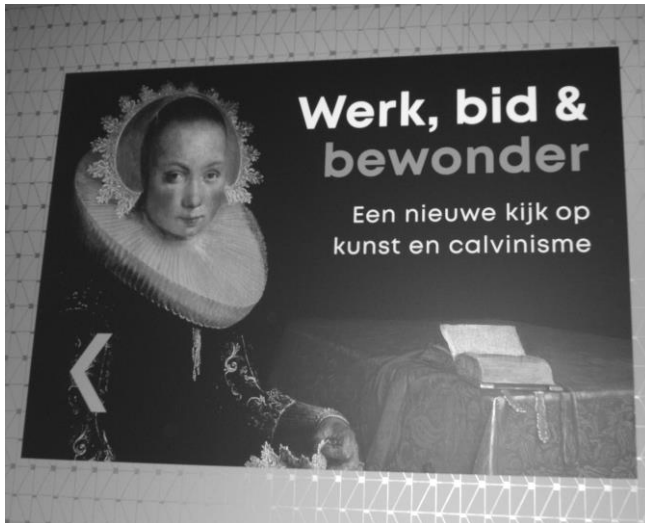
Zaterdag 6 april: Dordrechts Museum

U kunt alle hiervoor genoemde projecten ook steunen door uw gift over te maken aan de Diaconie van de Protestantse Gemeente te Fijnaart, Heijningen en Standdaarbuiten op bankrekening IBAN NL 54 RBRB 0691 260 540 onder vermelding van het project dat u wilt steunen.