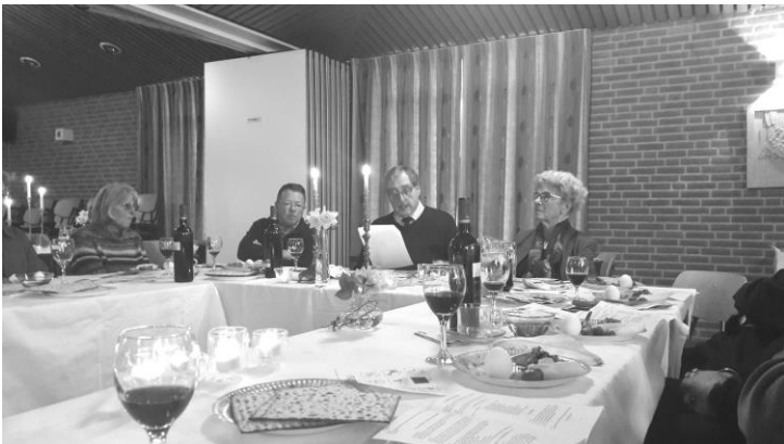
12 april: Sedermaaltijd in 't Trefpunt

Een vel van 30 bonnen voor € 40,-. Het verschuldigde bedrag kan overgemaakt worden op bankrekening NL02 RABO 0346703433 ten name van Kerkrentmeesters Protestantse Gemeente Fijnaart.