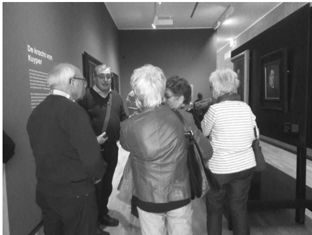
6 april 2019: Dordrechts Museum