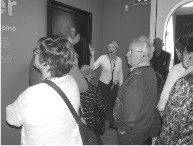
.....en ons langs diverse schilderijen loodste .....